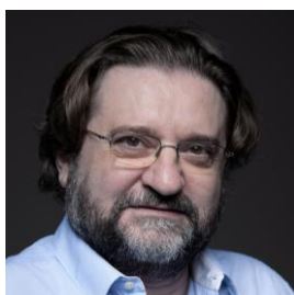
BOZÓKI ANDRÁS politológus, egyetemi tanár kulturális miniszter (2005-2006)