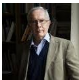
BOD PÉTER ÁKOS közgazdász, egyetemi tanár – társelnök ipari és kereskedelmi miniszter (1990-1991) a Magyar Nemzeti Bank elnöke (1991-1994)