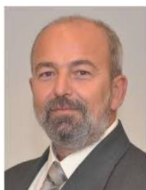
HOLODA ATTILA olajmérnök, közgazdász energiaügyi helyettes államtitkár (2012)