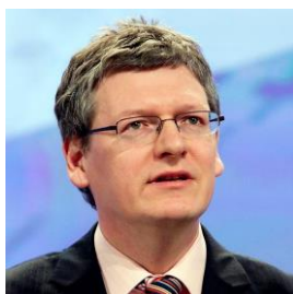
ANDOR LÁSZLÓ közgazdász, egyetemi docens EU-biztos (2010-2014)