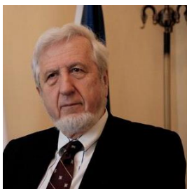
JESZENSZKY GÉZA történész, egyetemi tanár külügyminiszter (1990-1994)