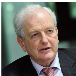
BÁRÁNDY PÉTER ügyvéd igazságügyi miniszter (2002-2004)