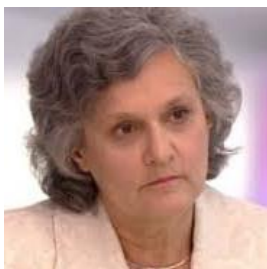
GÖNCZ KINGA orvos, pszichiáter ifjúsági, családügyi, szociális és esélyegyenlőségi miniszter (2004-2006) külügyminiszter (2006-2009) európai parlamenti képviselő (2009-2014)