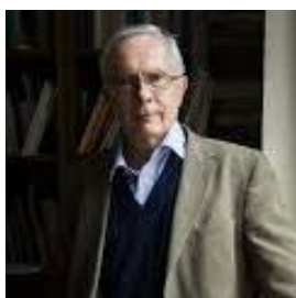
BOD PÉTER ÁKOS közgazdász, egyetemi tanár – társelnök ipari és kereskedelmi miniszter (1990-1991) a Magyar Nemzeti Bank elnöke (1991-1994)