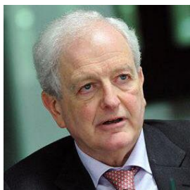
BÁRÁNDY PÉTER ügyvéd igazságügyi miniszter (2002-2004)