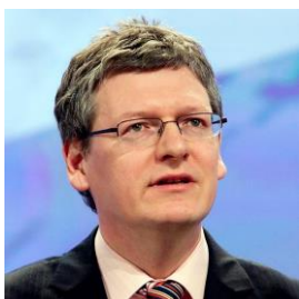
ANDOR LÁSZLÓ közgazdász, egyetemi docens EU-biztos (2010-2014)