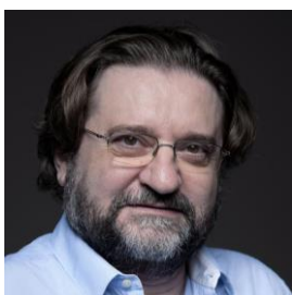
BOZÓKI ANDRÁS politológus, egyetemi tanár kulturális miniszter (2005-2006)