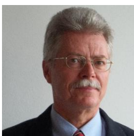
KAJDI JÓZSEF jogász

államtitkár, a Miniszterelnöki Hivatal vezetője (1990-1994)