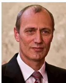
SZÉKELY TAMÁS orvos egészségügyi miniszter (2008-2010)