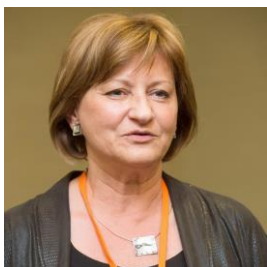
HEGYESINÉ ORSÓS ÉVA

európai parlamenti képviselő (2009-2014)